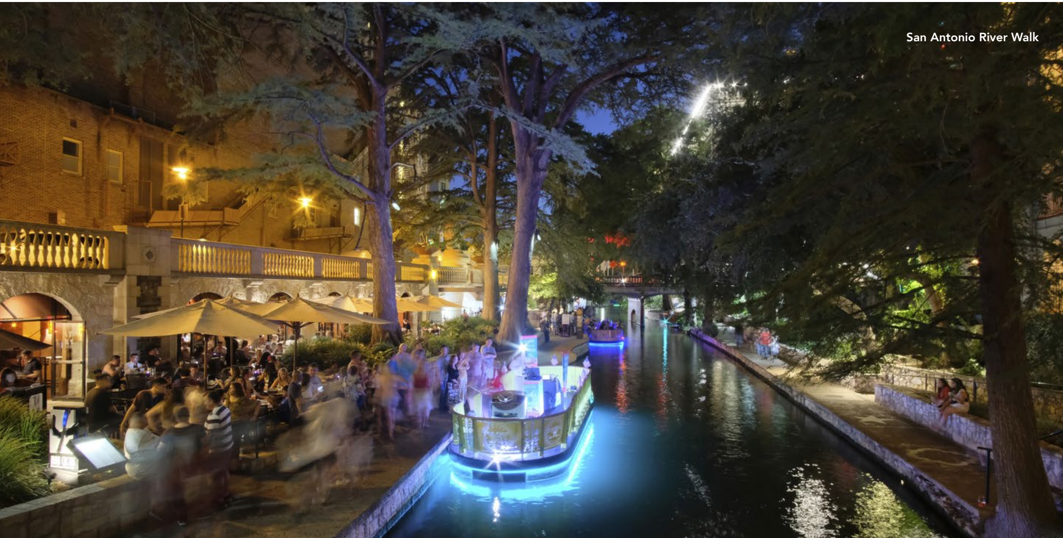
San Antonio River Walk