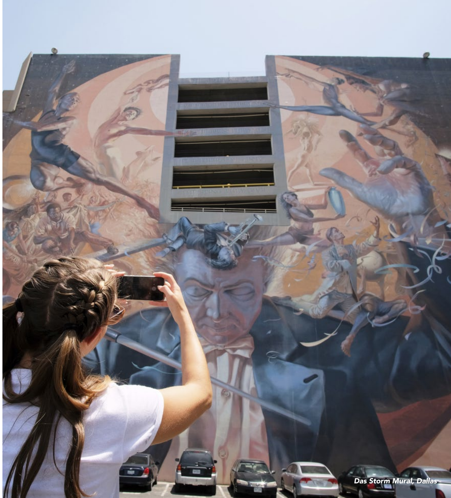
Das Storm Mural, Dallas