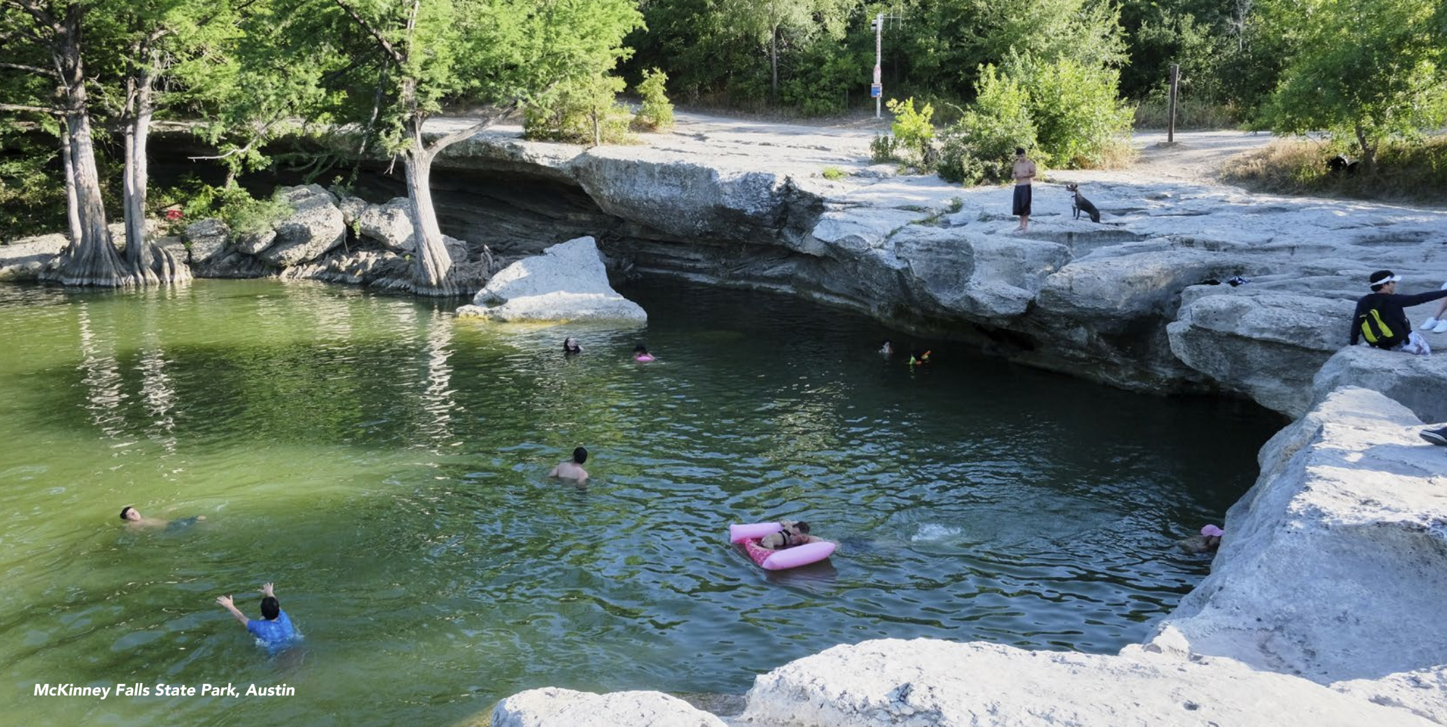
McKinney Falls State Park, Austin