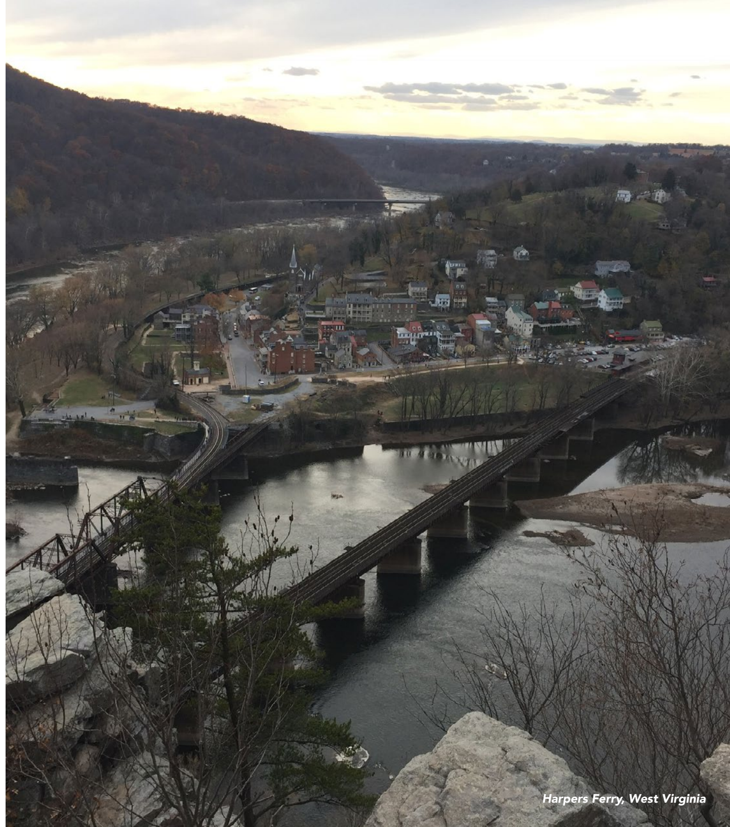
Harpers Ferry, West Virginia